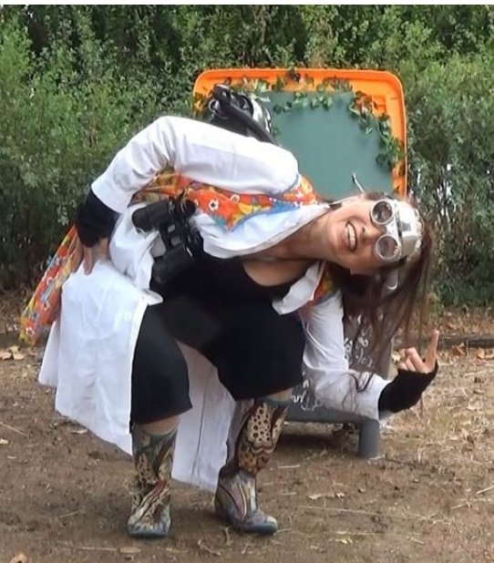
Festival d'Aurillac, 2022

Ce projet est là pour expliquer à nos enfants des villes (comme aux adultes qui l'auraient oublié), comment la nature est essentielle à nos vies, et leur rendre le droit d'être acteurs de la transition écologique qui les concerne au premier plan. Pour eux aussi le dérèglement climatique dont on parle tant est anxiogène : ils sont encore plus impuissants que nous, face à une situation qu'ils comprennent encore moins. Ce projet a donc pour ambition de les aider à mieux comprendre les enjeux et leur donner les moyens et l'envie d'agir. Car autant la nature est aujourd'hui en péril, autant elle peut aussi renaître : le compost est un écosystème, les plantes qui vont pousser grâce à lui recréent un cercle vertueux : elles produisent l'oxygène que nous respirons, créent la nourriture que nous mangeons, de la beauté pour nous rendre heureux.