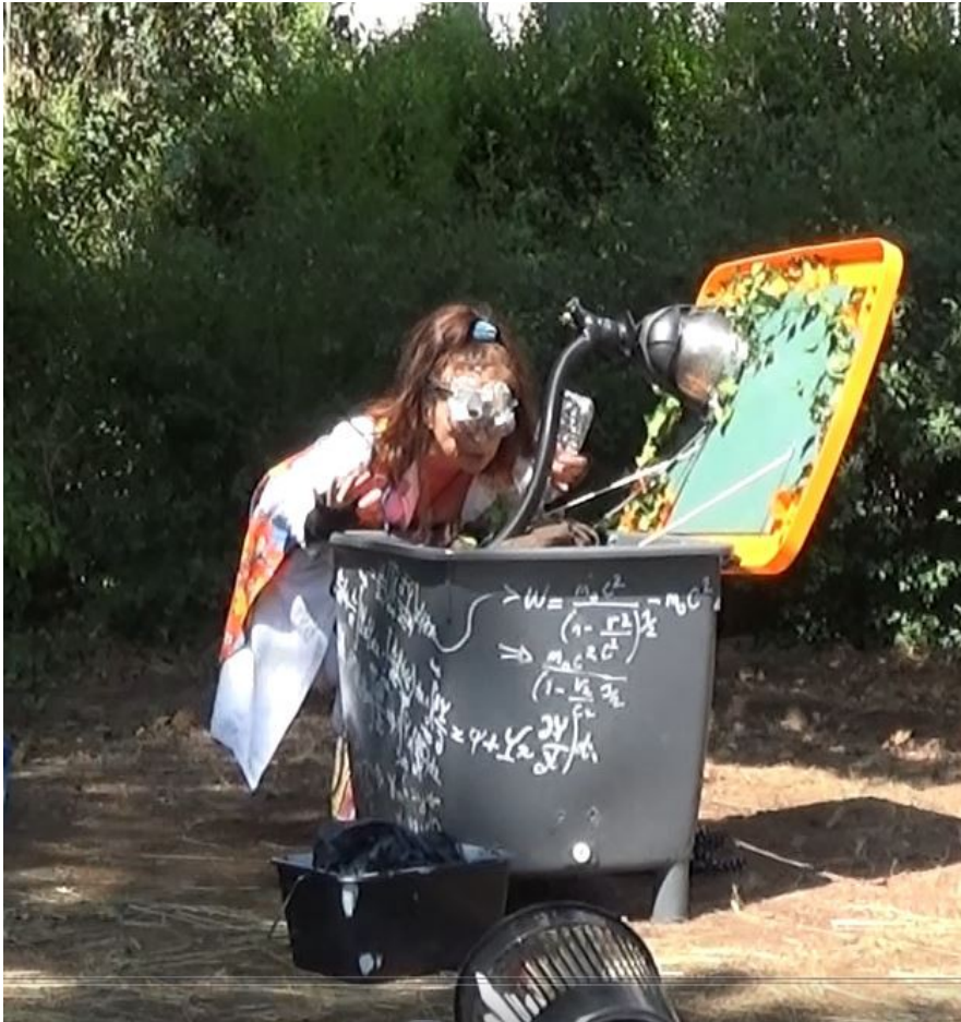
Festival d'Aurillac, 2022

LE COMPOST... C'EST SI INTÉRESSANT ? (...BEN OUI !)